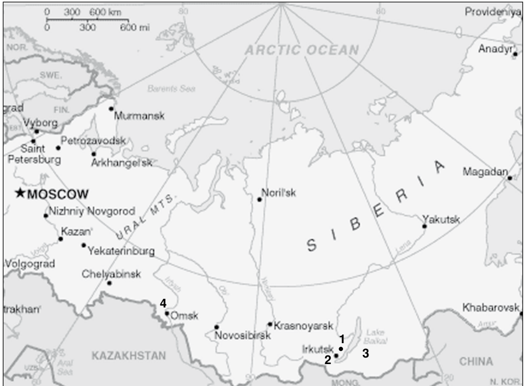
Deelkaart van Rusland: 1. Yelantsy 2. Irkoetsk 3. Baikalmeer 4. Omsk