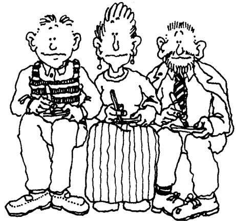
Drie deskundige juryleden

Leerkracht 1 : (leerkracht 1 is dus klassenleerkracht) Maken jullie je borst maar nat. Deze groep 8 heeft hééééél wat in huis!