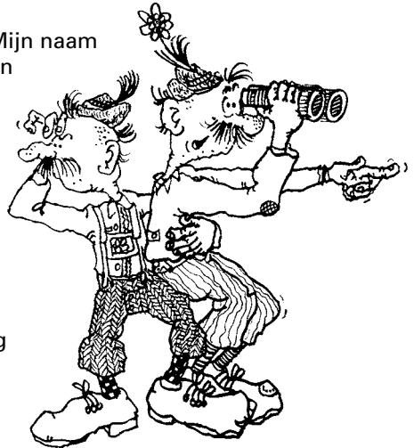
Wij voeren controle en beheer...

Theodorus : Precies Henriques. Goed gezegd. Eh... waar was ik ook alweer gebleven? Oh ja... het zwarte bomenbos wordt bestuurd door de Apekoolaap.